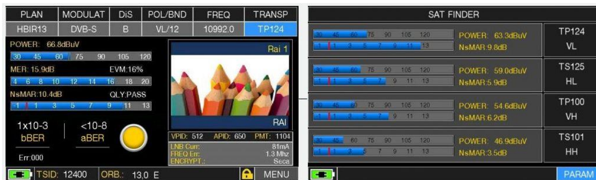
WYŚWIETLANIE POMIARÓW I ZDJĘĆ